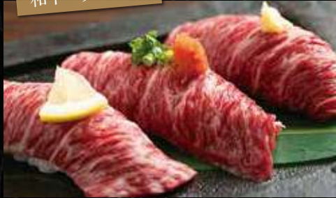
和牛ハラミにぎり