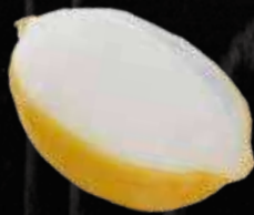
レモンシャーベット 300円 (税込 330円)