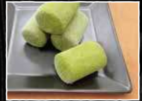
生チョコ抹茶アイス 280円 (税込 308円)