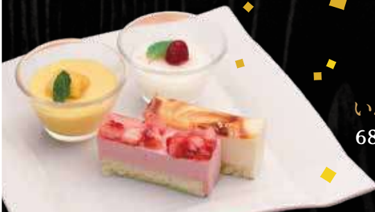
いろどりプレート 680円 (税込 748円)