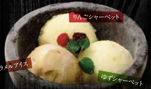
りんごシャーベット キャラメルアイス ゆずシャーベット