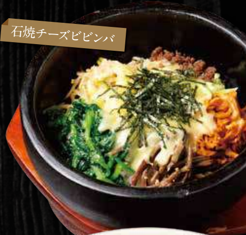
石焼チーズビビンバ