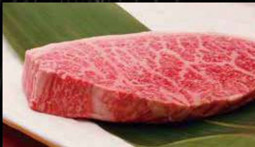
極上厚切りイチボステーキ