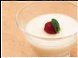
杏仁豆腐 200円 (税込 220円)