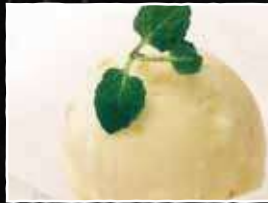
ゆずシャーベット 250円 (税込 275円)