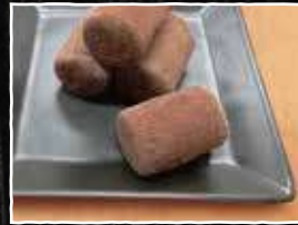
生チョコアイス 280円 (税込 308円)