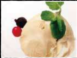
キャラメルアイス 250円 (税込 275円)