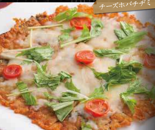
チーズホバチデミ