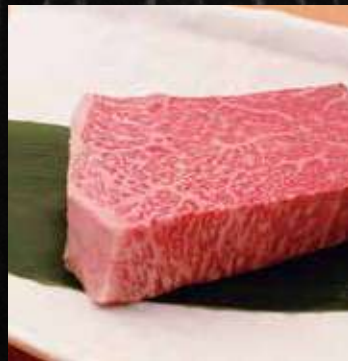
極上厚切りランプステーキ