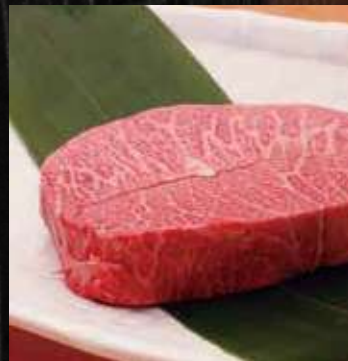
極上厚切りミスジステーキ