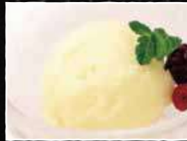
りんごシャーベット 250円 (税込 275円)