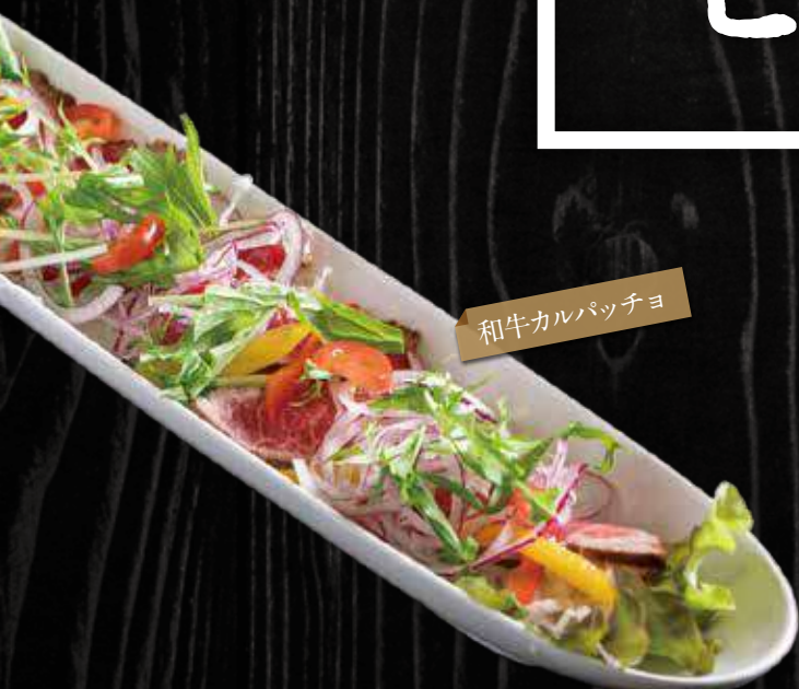
和牛カルパッチョ