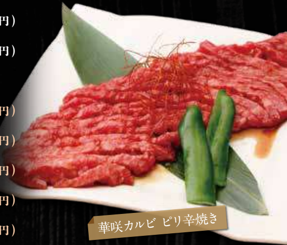
華咲カルビ ピリ辛焼き