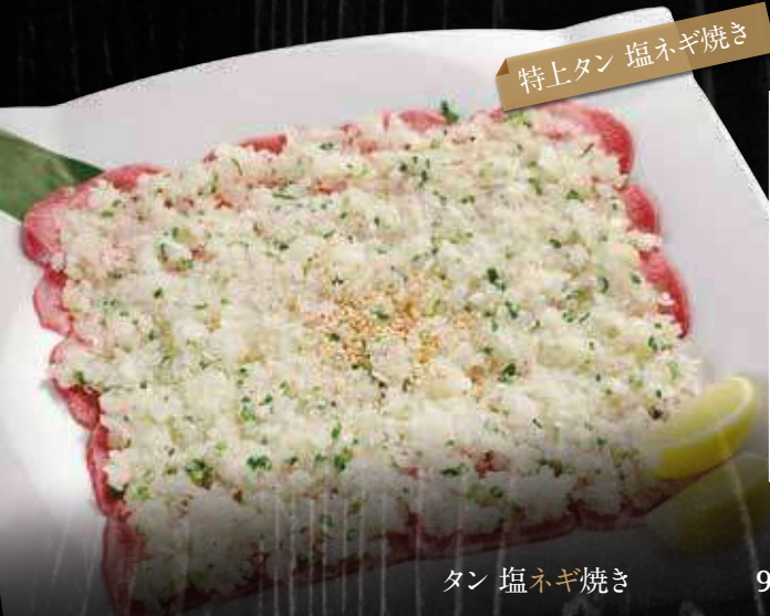
特上タン 塩ネギ焼き