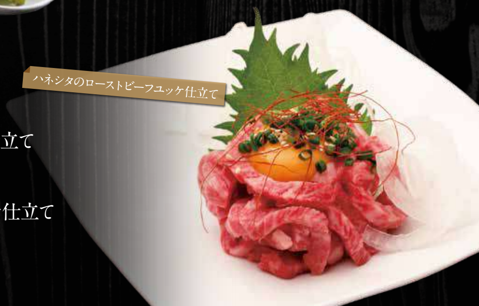
ハネシタのローストビーフユッケ仕立て