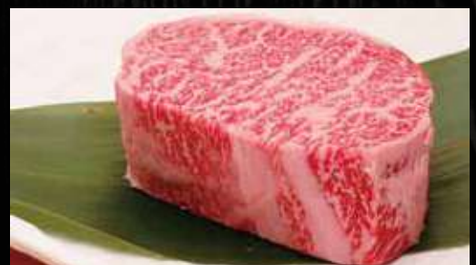
極上厚切りロース芯ステーキ