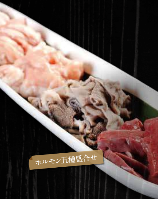
ホルモン五種盛合せ