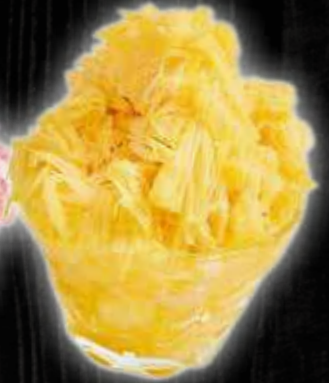
ふわふわマンゴー