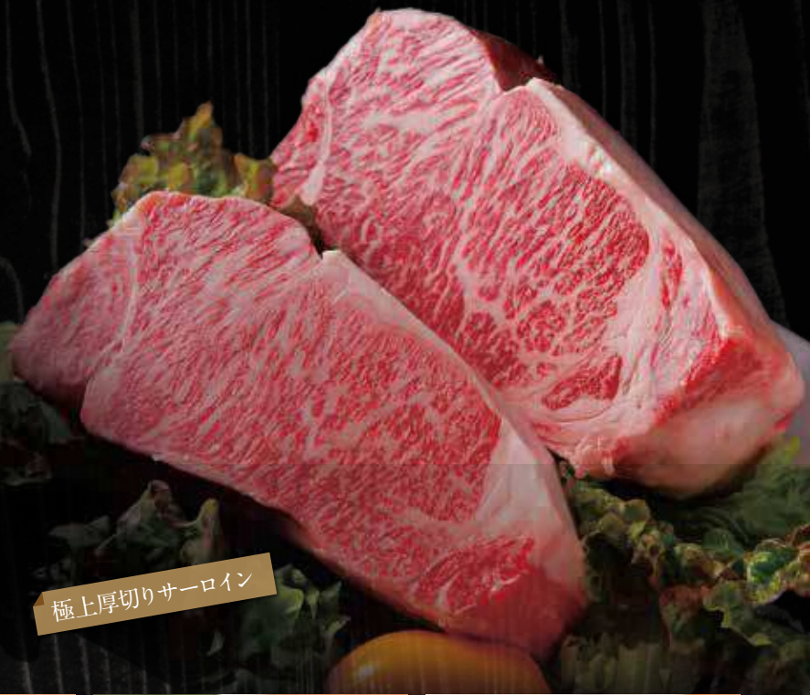
極上厚切りサーロイン