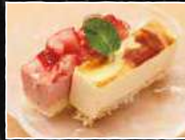
アイスクーキ 480円 (税込 528円)