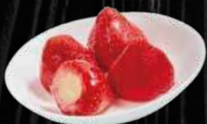
まるごと苺アイス 320円 (税込 353円)