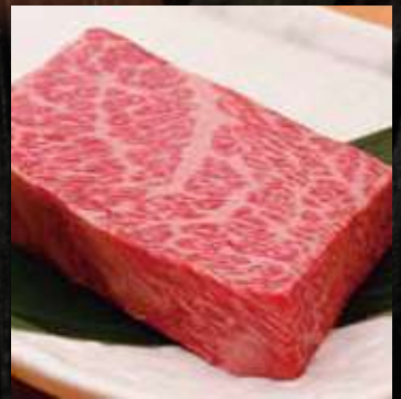
極上厚切りハネシタステーキ