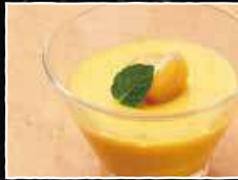
マンゴープリン 200円 (税込 220円)