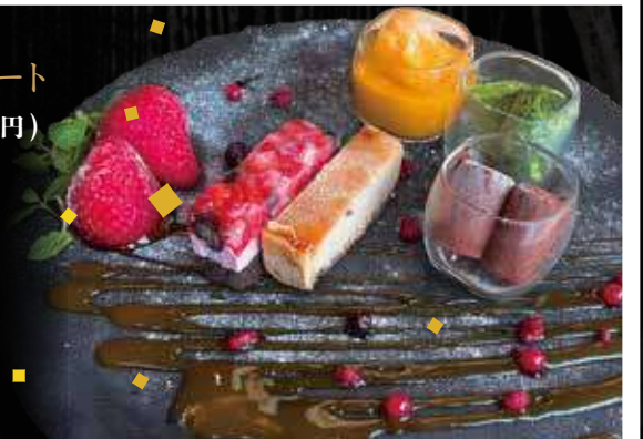
スペシャルプレート 980円 (税込 1,078円)