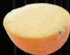
オレンジシャーベット 350円 (税込 385円)