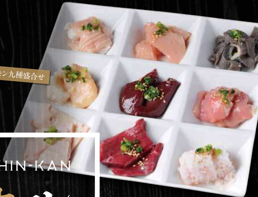
ホルモン九種盛合せ