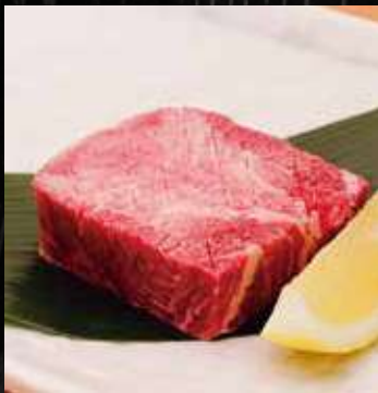
極上厚切りタンステーキ